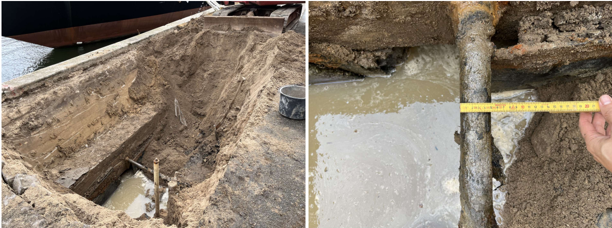
Billeder af opgravning bag spunsen. Tilstandsvurdering af et anker.