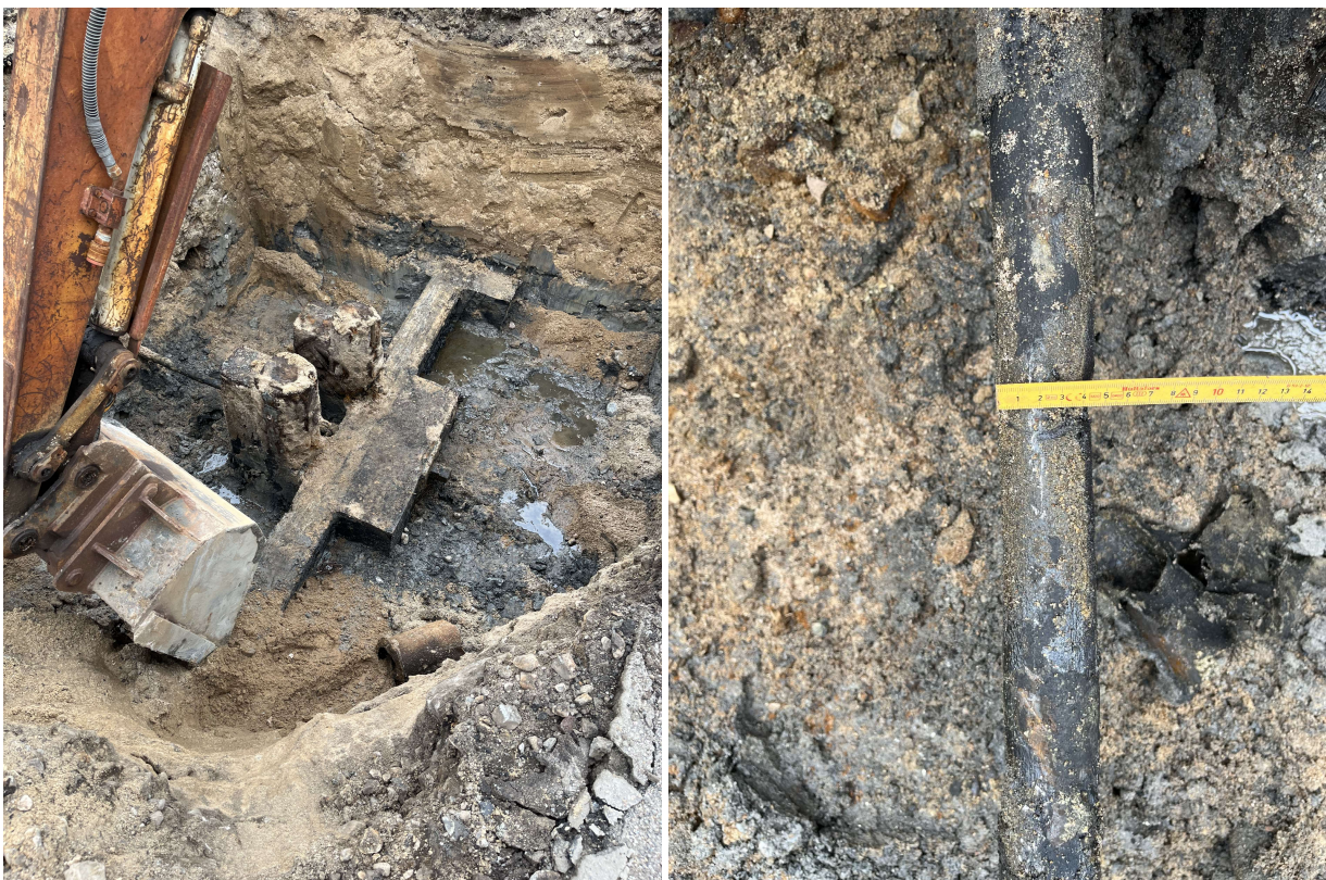
Billeder af opgravning ved en ankerbuk. Tilstandsvurdering af et anker og synlig buk (træ).