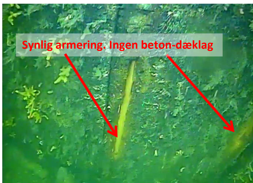
Billede af synlig armering. Ruster grundet manglende beton-dæklag

I forbindelse med spunsens frispuling blev der flere steder observeret synlig armering – Dvs. steder hvor betonen er forsvundet, og der nu er blottet armering. Dette nuværende/ikke eksisterende beton-dæklag er derfor for tyndt, hvilket medfører at armeringen rustet, med brud til følge.