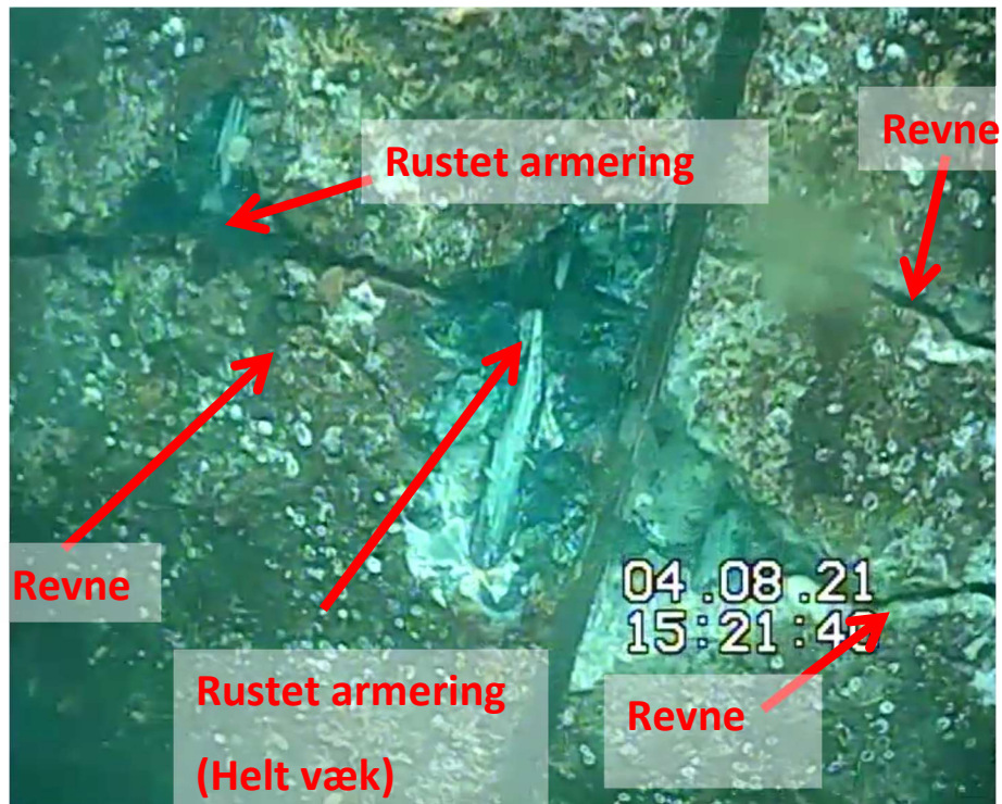
Billede af revner og overrustet / tæret armering (Billedets dato ikke korrekt, filmet sept. 2023)

Ved revner i betonen vil saltvand trænge ind til armeringen og få denne til at ruste. Flere steder blev dette eftersat, og det kunne konstateres at armeringsjernet flere steder var tydeligt bortrustet i revnens niveau. Dette er meget alvorligt, da spunsvæggens styrke derfor er yderst svækket.