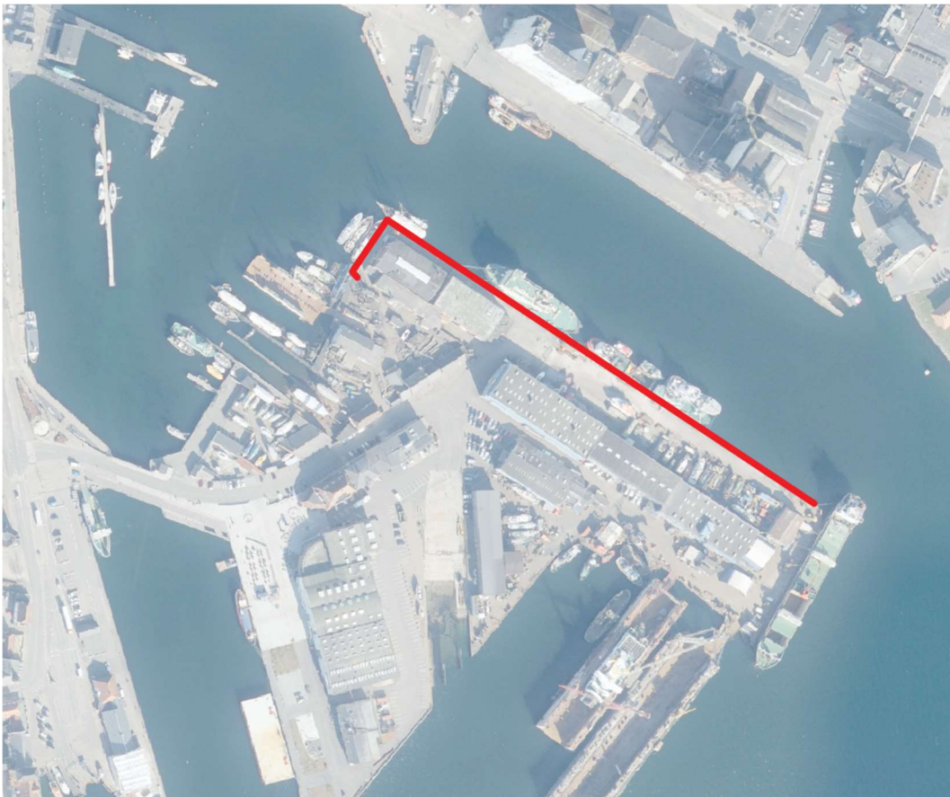
Den undersøgte strækning er sammenlagt 337 m. Udført i 1919. (Konstruktionen er ikke revnet på hele strækningen)

De typiske levetidsforlængende tiltag, kan normal vis udføres ved forstøbning (betonpåstøbning) og tætning af samlinger. Førstnævnte var det planlagte arbejder der skulle igangsættes.