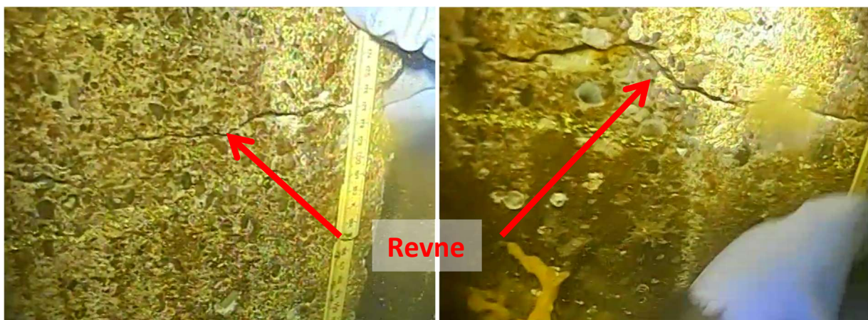
Billeder af revne

Revnen forløber vandret gennem plankerne ca. 2,5 meter under vandoverfladen. Revnen varierer typisk fra 2 til 3 meter under overfladen. Flere steder findes der revner i op til 4 niveauer.