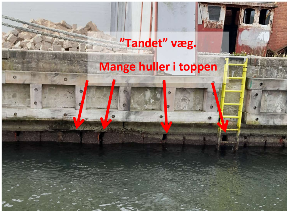
Billede af huller omkring vandlinjen.

Det netop stoppede arbejde (forstøbning) skulle udbedre større huller i spunsvæggen omkring vandoverfladen.